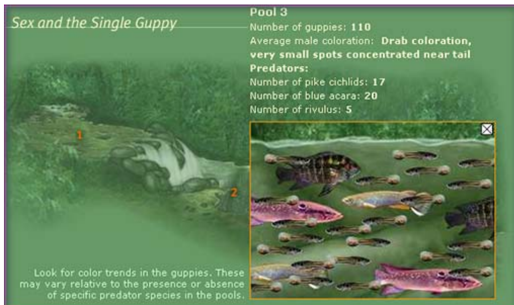
Fig 4. Bilden visar hur många guppys (samt vilken färgteckning som dominerar) och vilka rovfisksarter som finns i damm 3