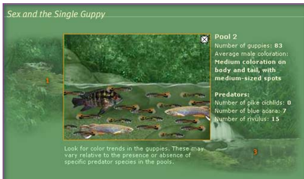
Fig 3. Bilden visar hur många guppys (samt vilken färgteckning som dominerar) och vilka rovfisksarter som finns i damm 2.