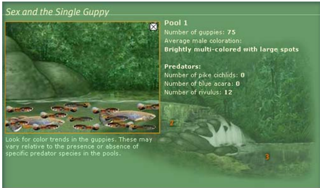
Fig 2. Bilden visar hur många guppys (samt vilken färgteckning som dominerar) och vilka rovfisksarter som finns i damm 1.